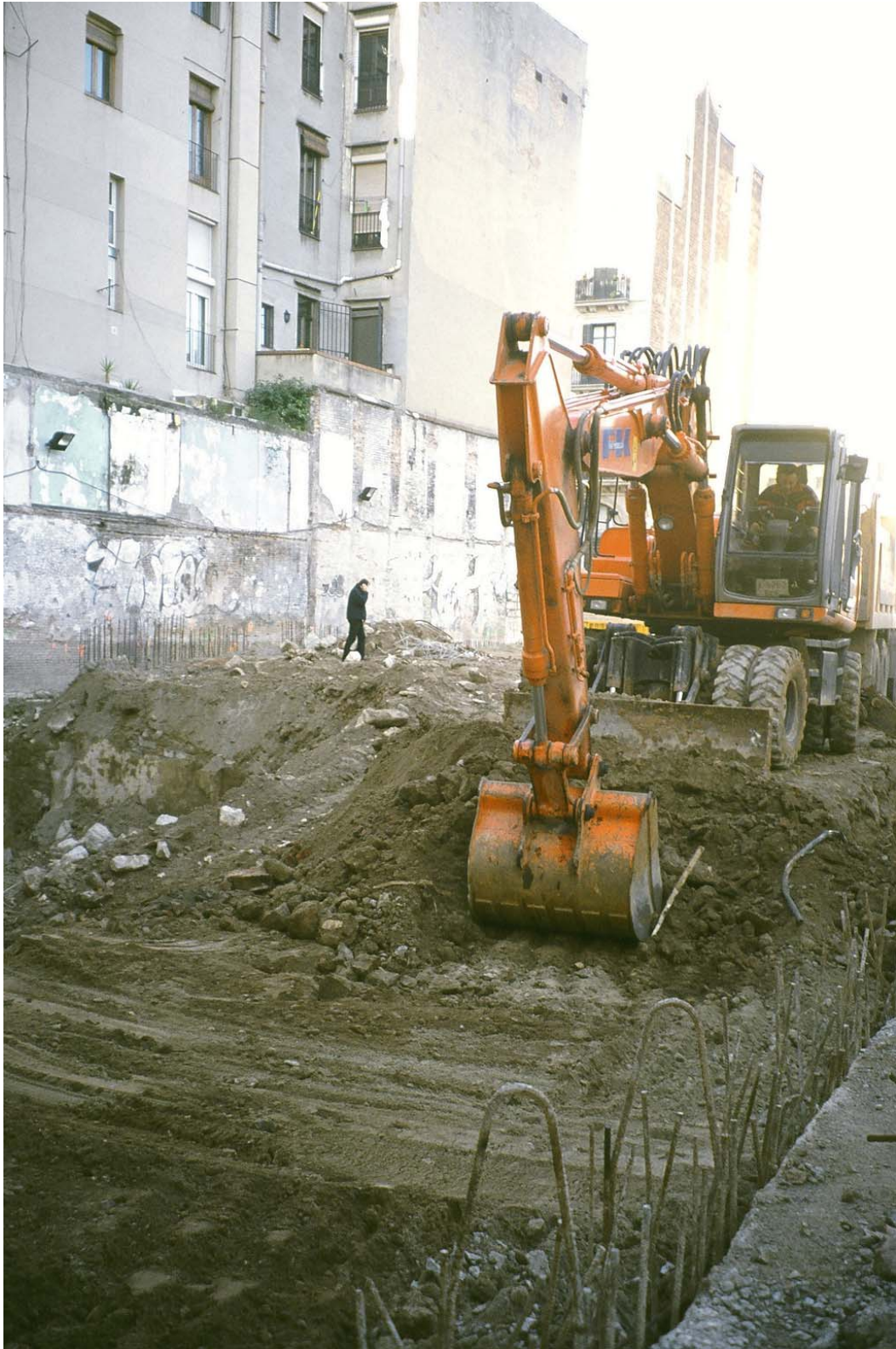
5. Procés de rebaix mecànic.