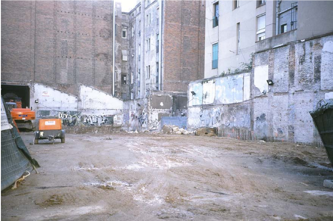
1. Vista general del solar abans de començar el rebaix.