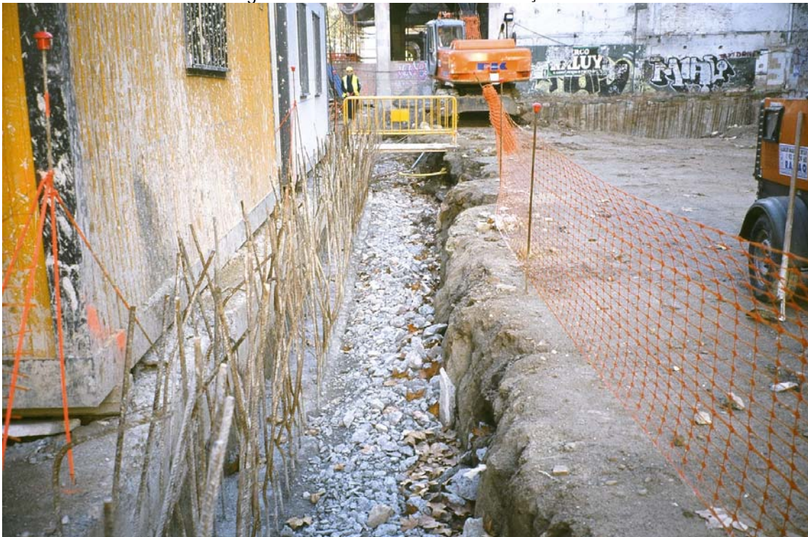
2. Rases dels murs pantalla.