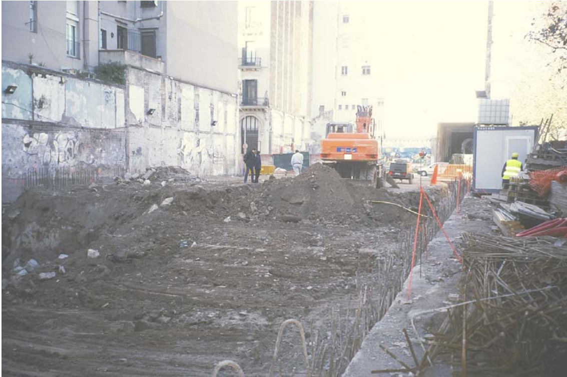
6. Panoràmica del rebaix general del solar.