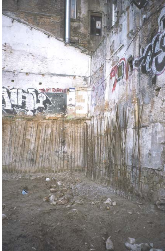
3. Detall dels murs pantalla abans de començar els rebaixos.