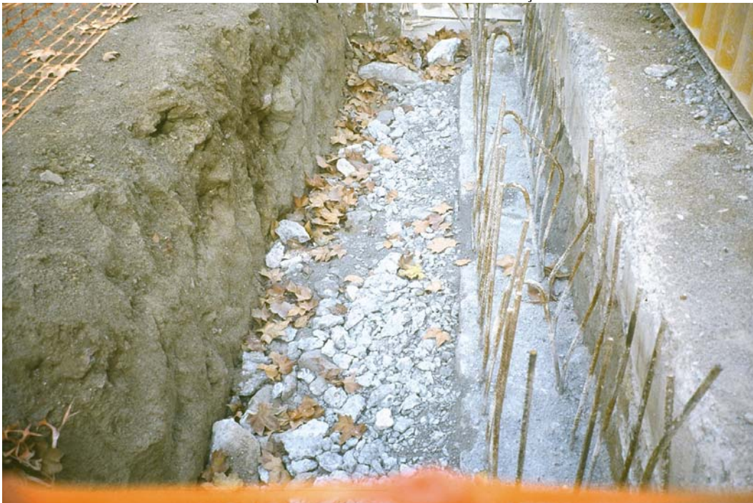
4. Detall de l'estratigrafia de les rases dels murs pantalla.