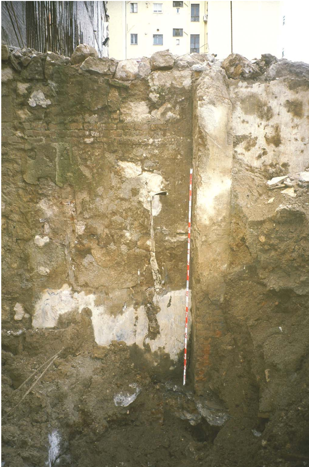
8. La mira recolzada al paviment d'un dels soterranis contemporanis.