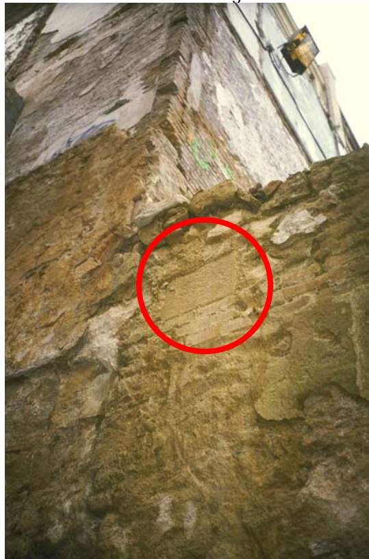
7. Detall dels carreus antics inserits al mur contemporani.