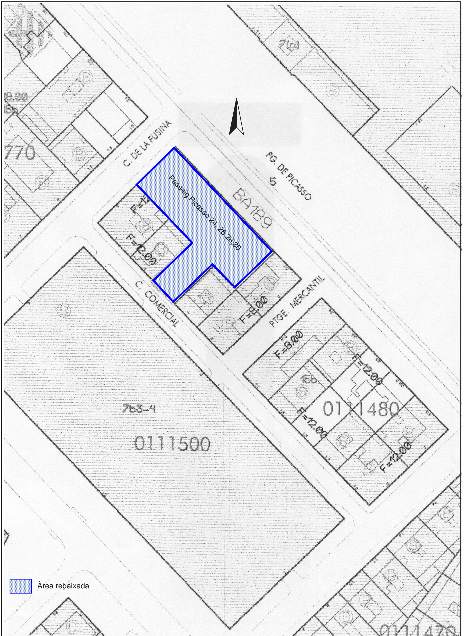
Localització del solar. Escala 1:500.